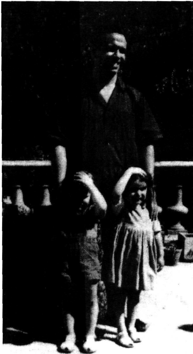
Amb la filla i la neboda, a Cotlliure.